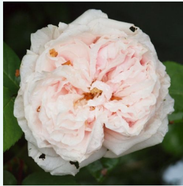
Ännchen von Tharau

rosa - historische, gallica-rose 150-210 cm stark duftende, gut wahrnehmbare rose - würzig-rosig Jean -Pierre Vibert