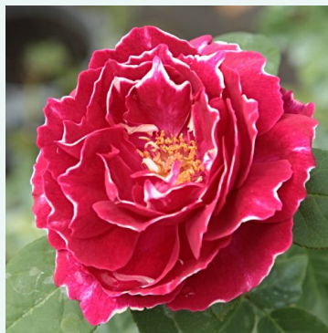
Baron Girod de l'Ain

rosa - historische, alte gartenrose 280-420 cm stark, lang anhaltend duftende rose - klassischer altrosenduft Rudolf Geschwind