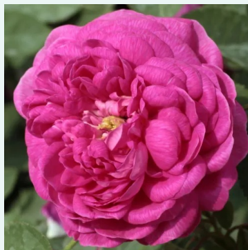
Rose de Resht

grün - historisch, china-rose 80-130 cm sehr schwach, kaum wahrnehmbar duftende rose - würziger charakter John Smith