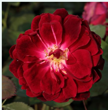
Gruss an Teplitz

gelb - historische, alte gartenrose 320-500 cm intensiv, gut wahrnehmbar duftende rose - frisch, fruchtig George Paul, Jr.