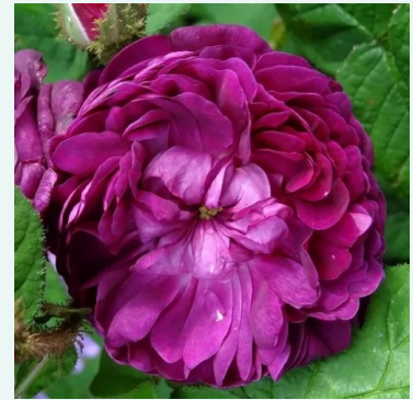
Capitaine John Ingram