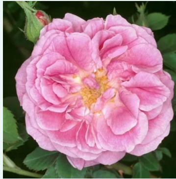
Queen of Bourbons

mittelrosa - historisch, damaszener rose 100-170 cm sehr stark duftende, den garten erfüllende rose - füllig, damaszener Alain Meilland