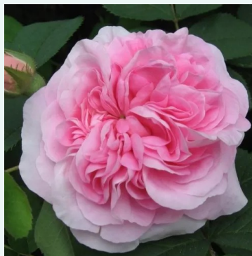
Königin von Dänemark

rosa - historische, damaszener rose 140-200 cm sehr starke, von weitem wahrnehmbare, duftende rose - parfümiert, rosenartig -