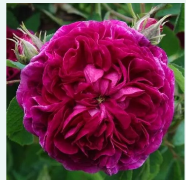
Charles de Mills

rosa - historisch, damaszener rose 135-225 cm sehr stark duftende, von weitem wahrnehmbare rose - süß-würzig, damaszenerartig