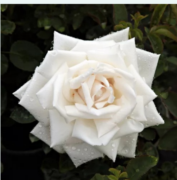
Frau Karl Druschki